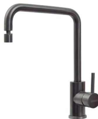
Black Ref.: 94520/512

Revestimiento PVD (Physical Vapor Deposition): é um processo para produzir um vapor metálico que é depositado sobre a peça como se fosse uma fina camada colorida.