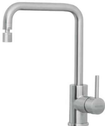
Aço Inox Ref.: 94520/012