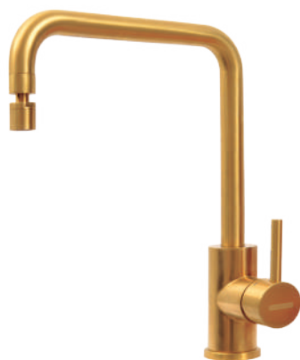
Gold Ref.: 94520/312