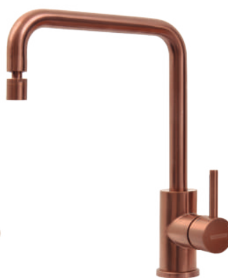
Rose Gold Ref.: 94520/412